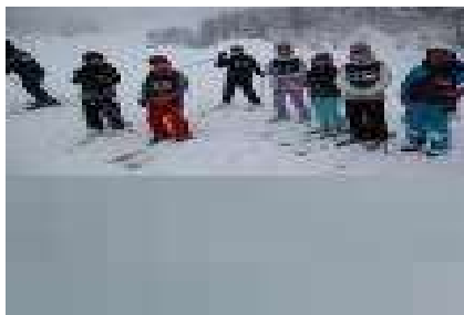
5, 6年にとっては すっかり馴染みの大台コース 滑りを満喫しました