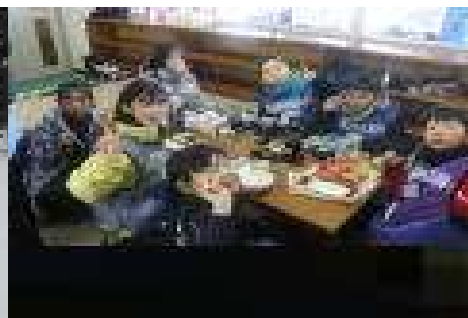
お弁当の時間も元気な4年生