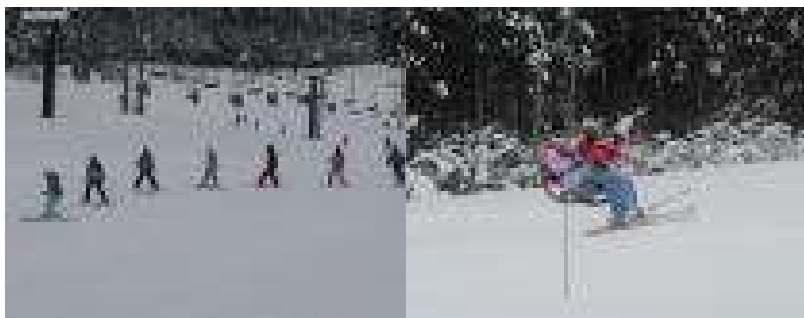
天気にも雪質にも恵まれて 滑るごとに上手になりました