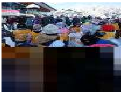
たくさんの方の保護者の方がお手伝いに来てくださいました