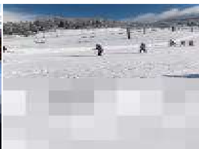
2年生は後三年のぶんを挽回できるくらいの晴天でした