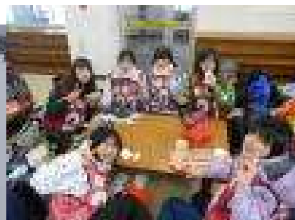
高学年もお楽しみはお弁当タイム