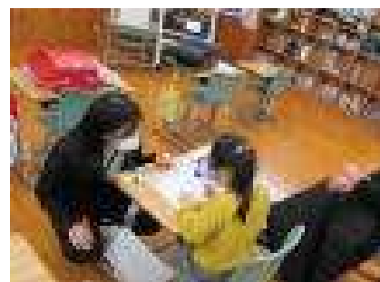
1年 すまいる・ひだまり・きらり・そよかぜ 国語：読んだり書いたりす力が、グングン伸びています