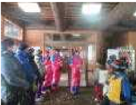
1月17日(金) 吹雪のためスキー小屋ではじめの会 悪天候にも負けない たのしい4年生