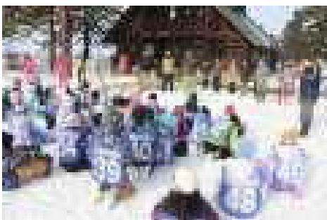
1月21日(火) 眩しいくらいの天気にも恵まれた3年生