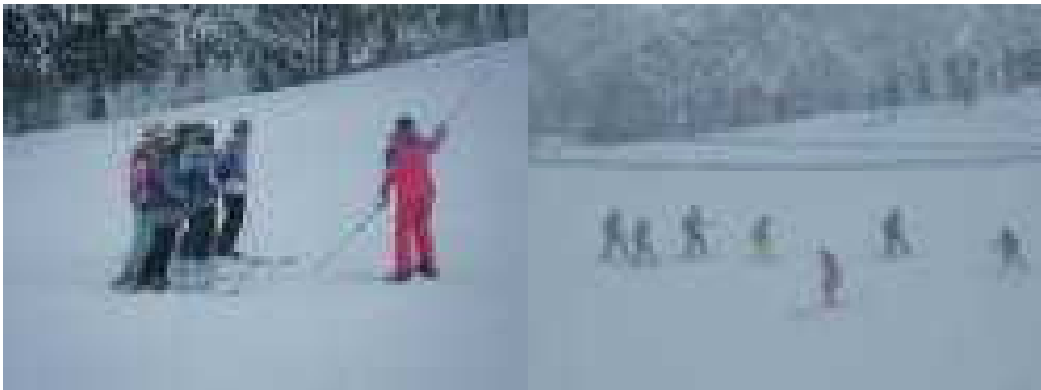
1月15日(水) 全校の先陣を切って6年 後三年スキー教室

保護者の皆様には、お忙しい中でのスキー指導、お手伝い、運搬、道具準備等へのご協力、本当にありがとうございました。来週のスキー教室もよろしく願いたします。