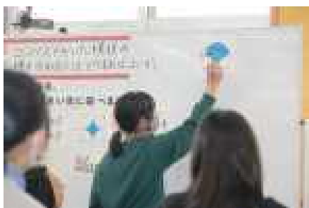
自分の考えを伝える