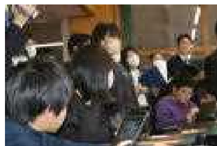
輝く姿がたくさん見られました