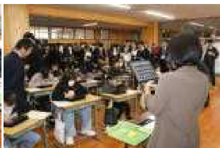
3階のプレールームを埋め尽くすほどの たくさんの先生方が 参観する中で