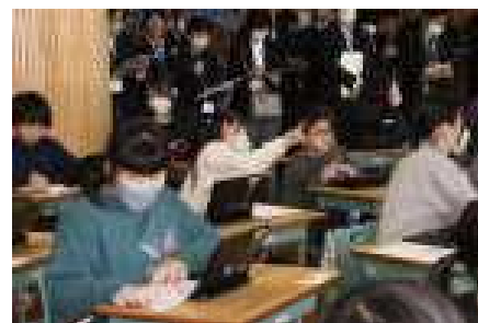
友だちと学び合い