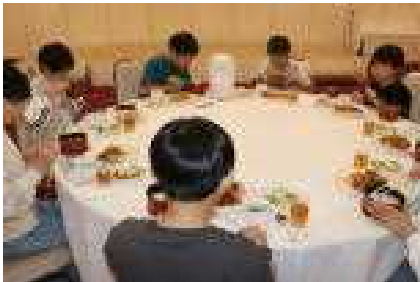
松興会館での豪華な昼食タイム

今回、このような貴重な体験学習を企画していただきました秋田県南旭川水系土地改良区ならびに秋田県仙南土地改良区の皆さま、本当にありがとうございました。