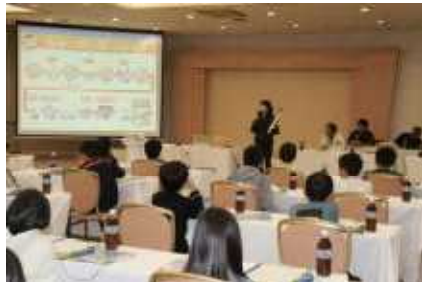
お米と野菜の勉強会