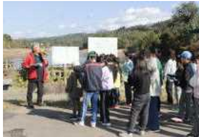
周りの紅葉が美しい明永ダム