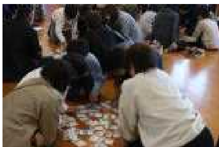
ひまわり：社会「残したいもの、伝えたいもの」