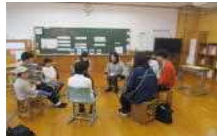
きらり：「音で楽しもう！」