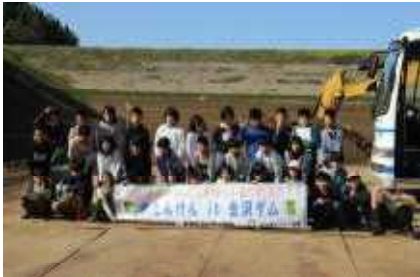
現在は渇水状態の金沢ダム

4年生は、秋田県南旭川水系土地改良区と秋田県仙南土地改良区の皆さまのご協力により「田んぼの水はどこからくるのだろう」をテーマに、美郷町の金沢ダム、横手市の明永ダムと大松川ダムの三つのダムを見学しました。金沢ダムでは、渇水状態にして土砂を搬出しているため、めったに体験できないダムの底を見学することができました。また、今回の訪問先で最も大きな大松川ダム（幅296m、高さ65m）では、ダムの大きさと水量の豊かさに驚いていました。