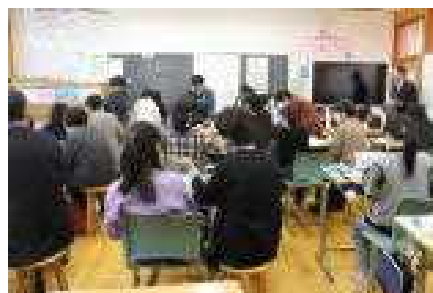
あおぞら：家庭科「ミシンで楽しくソーイング」