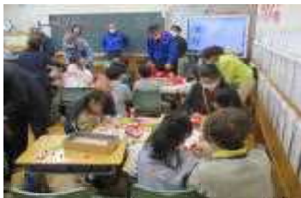
すたあ：図工「うさぎボックス」

火曜日の祖父母参観日には、おじいさんおばあさんをはじめ、家族の皆様にとくさんご参観いただきました。祖父母参観ということで、家族の方と一緒に活動が多かったのですが、和気藹々とした雰囲気の中で、子どもたちもとてもうれしそうでした。家族の皆様もご家庭では見られない子どもたちの姿をご覧になり、新たな発見をし成長を感じられたのではないかと思います。お忙しい中ご参観いただき、本当にありがとうございました。