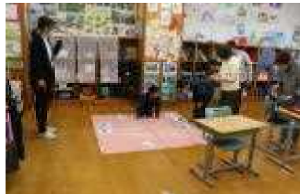
そよかぜ：「生き物大すき」