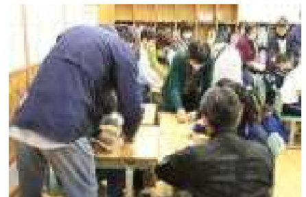
はあと：算数「かたちであそぼう」