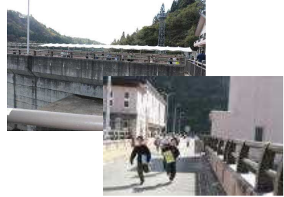
おもいっきり走れるほど大きい