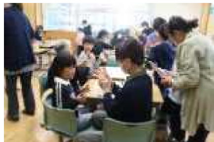
ドリーム：生活「昔遊びを楽しもう」