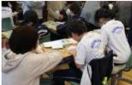
はあと：図工「このかたちへんしんすると」