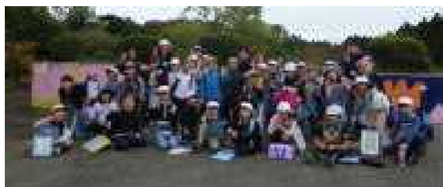
楽しかった思い出の記念写真