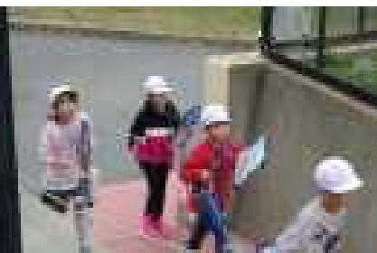
協力して園内をまわるぞ！