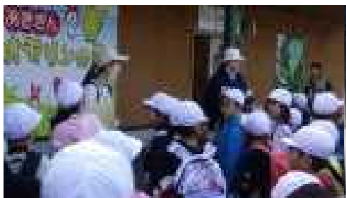
約一時間かけて無事動物園に到着

気持ちの良い秋晴れの下、ドリーム学年の子どもたちが、生活科の学習で大森山動物園にでかけました。午前中はグループごとに、地図を見ながら、協力して動物を観察してまわることができました。また、サル山では餌やり体験も楽しみました。昼食は愛情たっぷりのお弁当をいただきました。午後からは、「アソヴェの森」でサーキットに挑戦し、おもいっきり遊びました。初めて大仙市を飛び出してのFWでしたが、友達と協力して活動を楽しむことができた経験は、子どもたちにとって、とても大きな財産になりました。