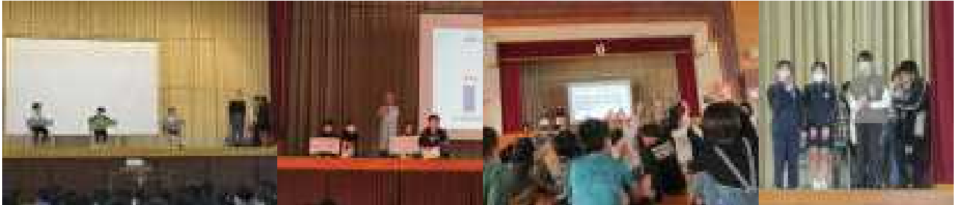
ゲーム大好き君と睡眠バッチリ君登場 高学年ほど「疲れがとれにくい」「授業中眠くなる」割合が高くなっていました