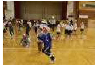
フラミンゴのまねっこ (片足立ちが難しい)