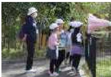
動物の鳴き声聞こえるかな