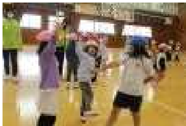
体全体を使ったじゃんけん