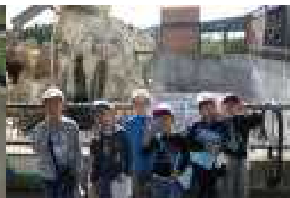
みんなで仲よくピース(^_^)v