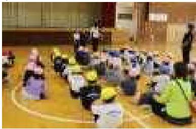
一年生と一緒にしっかり話を聞いています

すこやか園年長組の子どもたちが、来年度の入学に備えて、一年生の子どもたちと一緒に体育の授業を体験しました。体育では体全体を使ってじゃんけんをしたり、生き物になりきったりしました。園児たちは、一年生の担任の指示をよく聞いて、時間いっぱい活動を楽しむことができました。また、一年生も園児にやさしく声をかける姿がたくさん見られ、少しずつ二年生に近づいていることが感じられました。