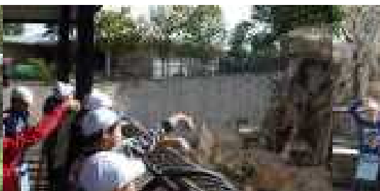
餌やり体験「仲良く食べてね」