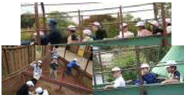
「アソヴェの森」大人気のなが～い滑り台