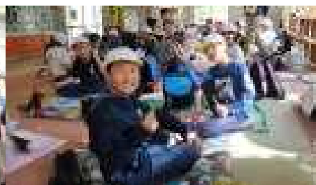
愛情いっぱいのお弁当 とってもおいしいです♡