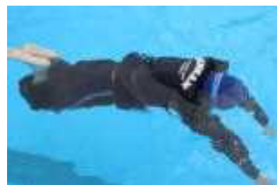
1年生・6年生 合同プール