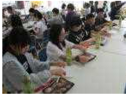
保呂羽での最後の昼食