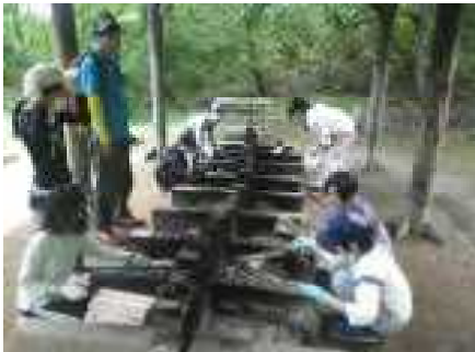
上手に火をおこせるかな