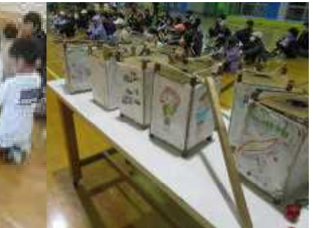
手作りちょうちんを持ってナイトハイクへ