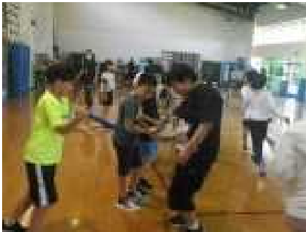
仲間と協力してPA活動