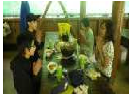
ようやく完成「いただきま〜す」