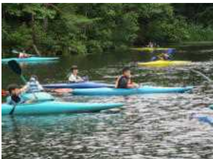
初めてのカヌー体験