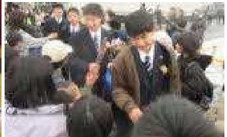
下級生との別れを惜しむ卒業生