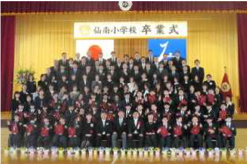
ジャンプ学年卒業写真