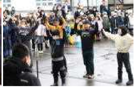
エールを送る5年生の皆さん