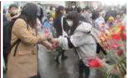
感謝の花を受け取る卒業生