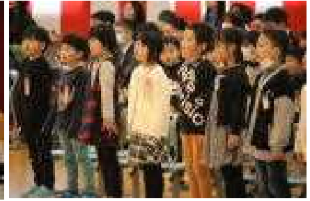
感謝の気持ちを届ける在校生