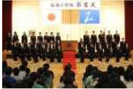
卒業証書を手にしたジャンプ学年