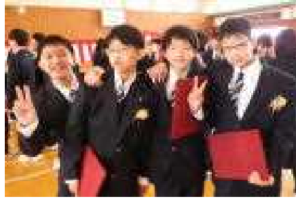
制服が似合うジャンプ学年