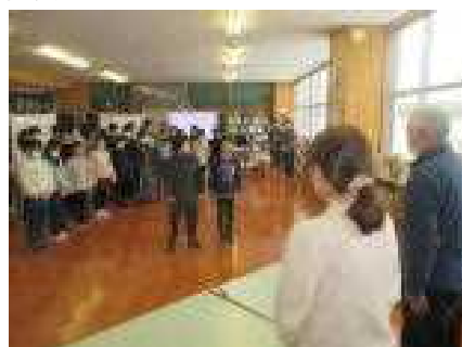
代表者によるお礼のこたば