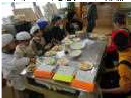
試食 (みかんやポテトチップスなど)