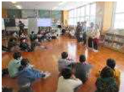
3階ホールではじめの会

このように、5年生が計画・準備して実施した収穫感謝祭は大きな成果を残して終わることができました。参加者全員が、お餅の新しい魅力と今後の農業について考える貴重な時間となりました。