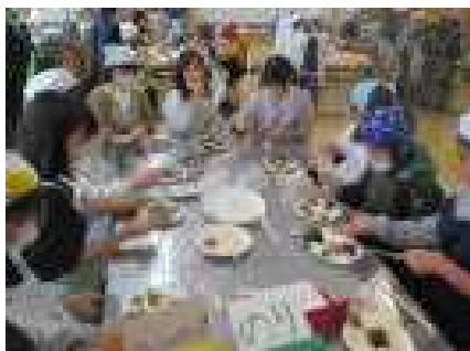
試食 (のりやハンバーグなど)