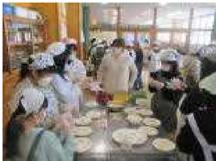
つきたてのお餅の準備完了