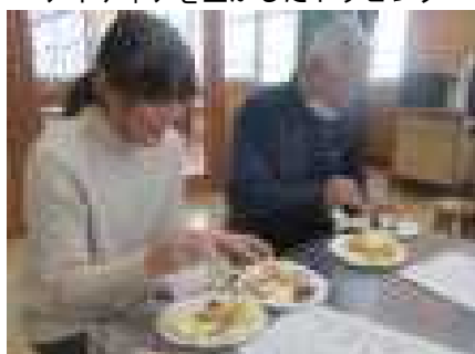
〇〇さんと〇〇さんも試食