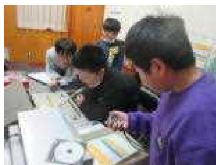
長声挑戦者と計時する放送委員

この長声大会は、12月21日まで、3・4年生の部、2年生の部、1年生の部がそれぞれ開催されることになっています。