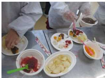
アイデアを生かしたトッピング