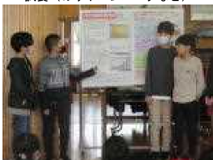
発表「食料自給率を上げるために」