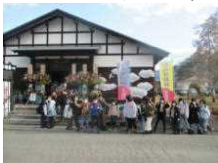
わらび座小ホールに入場する3年生

1～3年生の皆さんが、あきた芸術村わらび座小劇場でミュージカル「新解釈・三湖伝説」を鑑賞しました。初めてわらび座の本格的な劇場で鑑賞することになった1～3年生の皆さんは、とてもわくわくした気持ちで入場しました。