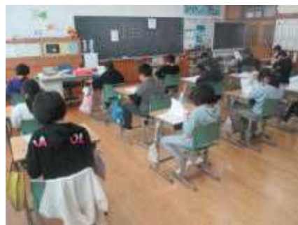
問題に取り組む4年1組の皆さん

初めてこの調査に取り組んだ4年生の皆さんも最後までしっかり集中して問題に向かっていました。