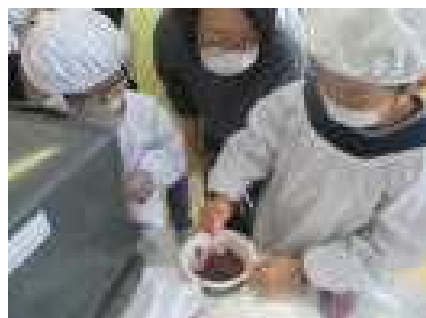
チョコレートを電子レンジで加熱