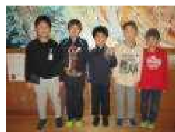
○○○○さんと美郷FCの皆さん