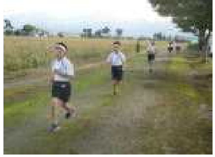
長い外周コースを走る3年男子