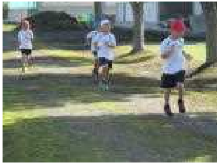
腕ふりがいい1年男子