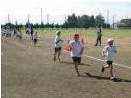
元気に駆け抜ける2年男子