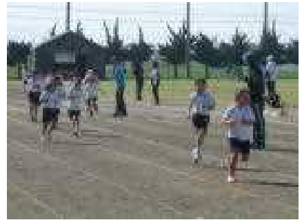
走りのフォームがいい2年女子