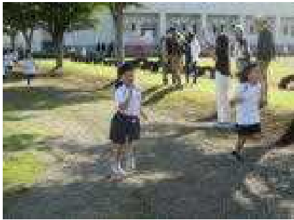
応援を受けて走る1年女子