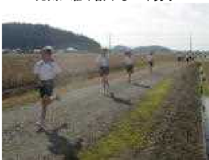
軽快な走りの4年女子