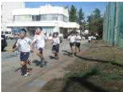
力強い走りの5年男子