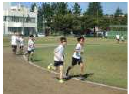
自己ベストを目指す6年男子