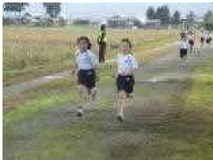
互いに引っ張り合う3年女子