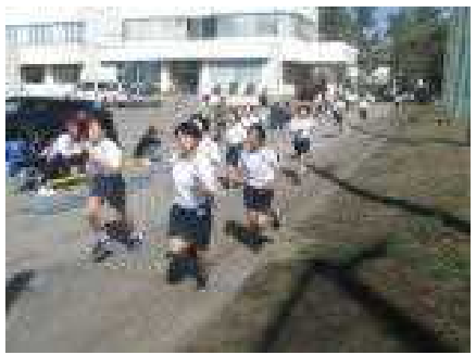
風のように走る5年女子