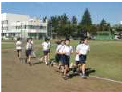
安定したフォームで走る6年女子