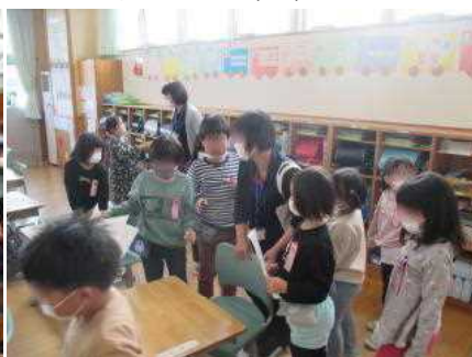
なつかしいすこやか園の先生方

お知らせ これまでは、各学年の学年報（おたより）は、ほぼ毎週発行していましたが、後期から、隔週、または、必要に応じて発行することになりました。ご了承ください。