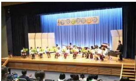
公民館で演奏するスクールバンド部

プログラム1番のスクールバンド部は「千本桜」と「明日があるさ」の2曲を演奏しました。ステージに上がった子どもたちは、多くのお客さんを前に少し緊張した様子でしたが、演奏が始まるとしっかり集中し、これまでの練習の成果を発揮して楽しく演奏しました。続く2曲目では、会場からの手拍子も一緒になり、最後は大きな拍手をいただきながら演奏を終えました。