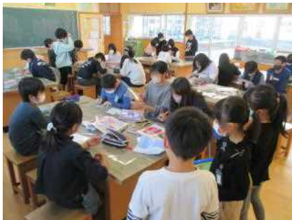
イラストアート&パソコンクラブ