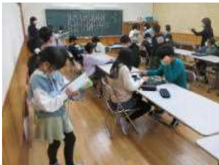
将棋・オセロ・囲碁クラブ

将棋・オセロ・囲碁クラブ ----- オセロ対戦 スポーツクラブ ----- ドッジボール 実験・科学クラブ ----- 空気砲作り イラストアート クッキング・手芸クラブ ----- たこ焼き作り &パソコンクラブ ----- プラ板での創作活動