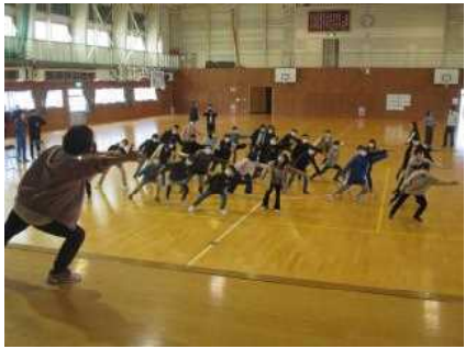
鏡の(左右反転)の動き