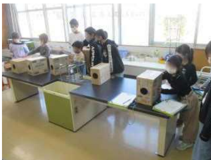
実験・科学クラブ