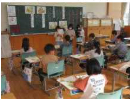
前に出て元気に発表

1年1組で、すこやか園の先生方による道徳の授業参観がありました。すこやか園の先生方と久しぶりに会った子どもたちははとすらうれしそう、いつも以上に張り切って学習してきました。そして、お話に出てきた意地悪な「おおかみ」や優しい「くまさん」の気持ちを考えたり、役割演技をしたりする様子をしっかり見ていただくことができました。