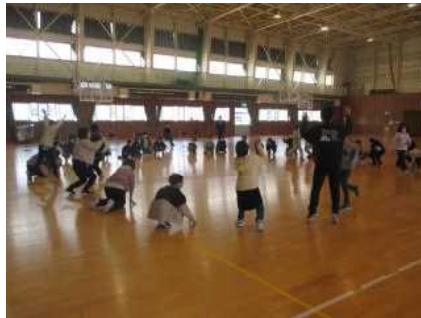
一体感が出てきて笑顔がいっぱい

美郷町生涯学習課事業のコミュニケーション教室が5年生を対象に行われました。わらび座の皆さんを講師に、相手の言葉を聞いてコミュニケーションする時の心の変化や気持ちが通じた時のうれしさの実感など、様々なプログラムを体験しました。