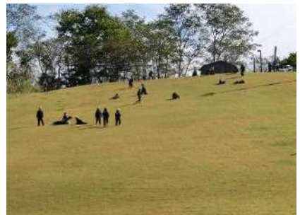
全身で遊んだ後三年スキー場