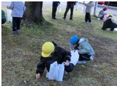
夢中で木の実拾い

それから後三年スキー場の頂上まで行き、雄大な景色を楽しみました。そして、広い斜面を何度もかけ下りたり転がったりして、全身で秋の自然を満喫しました。