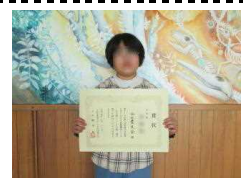
○○ ○○○ さん