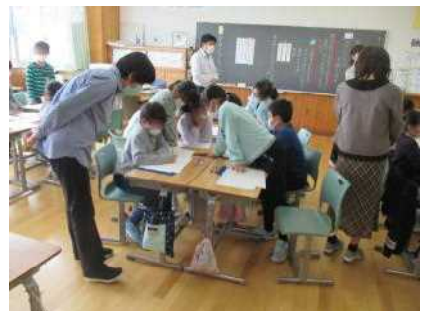
話し合って原稿を修正

グループごとに、体育館が広いこと、遊べる中庭のこと、みんなの笑顔のことなど、たくさんのじまんについて書きました。その原稿を各グループで読み合い、もっと分かりやすくするためにアドバイスしました。このようにして他のグループからももらったアドバイスを参考に子どもたちは、より分かりやすい内容にするため、熱心に話し合いながら原稿を修正しました。なお、この授業は、日常的な提案授業として校内の他の先生方も参観しました。