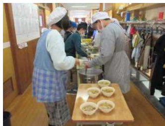
さつまいも汁を用意する5年生

5年1組でもさつまいも汁を盛り付けしてました。当日5年生は、家庭科のみそ汁の学習で、さつまいもが話題になったばかりでした。