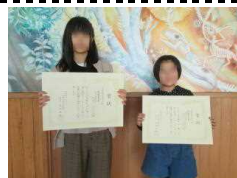
○○ ○○○ さん ○○ ○○ さん