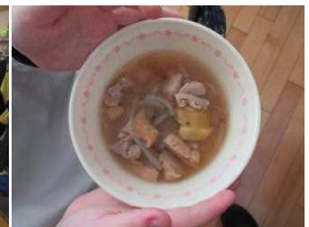
おいしかったさつまいも汁