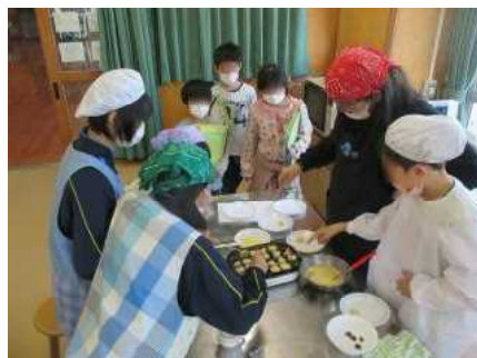
クッキング・手芸クラブ