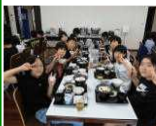
朝から元気いっぱい