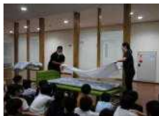
ふとんの敷き方レクチャー