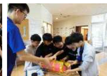
トレジャーハンティングで一位ゴール！