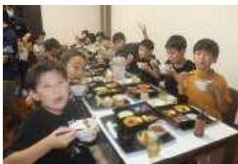
おいしすぎてご飯を10杯食べた人も