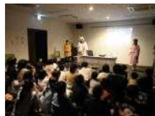
横手星の会による屋内での星座教室