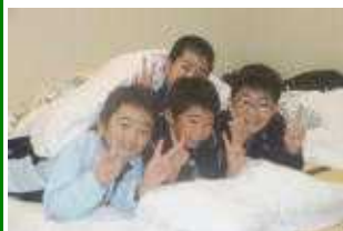
初めてのお泊まりは 嬉しすぎて なかなか眠れませんでした