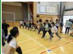
体全部で楽しんだグループワーク

グループワークもお泊まりもトレジャーハンティングも友だちと声をかけあい協力し合いながら、絆を深めることができた二日間でした。