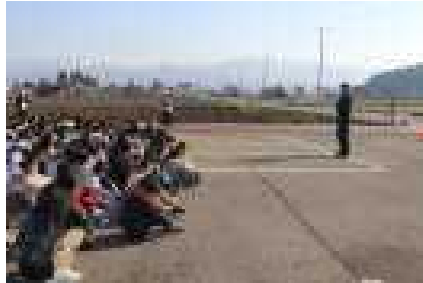
冬場の避難は児童クラブ駐車場