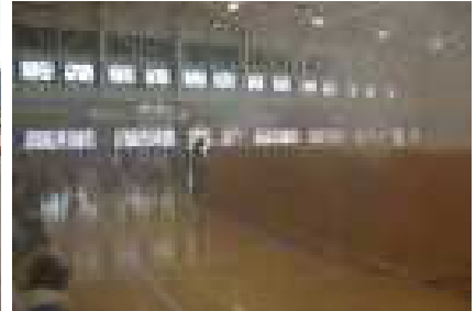
煙の中を歩く練習（煙道体験）