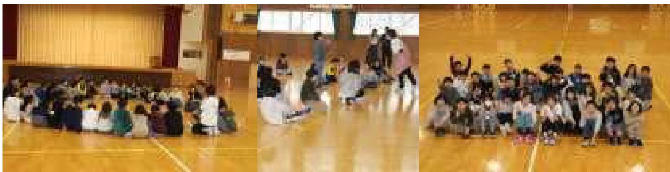
円になって考えを伝え合います

4年生を対象にしたコミュニケーション教室を開催しました。この教室は美郷町教育委員会が主催し、コミュニケーションセミナーを企画しているサイテック様とわらび座のコミュニケーショントレーナーの方々をお迎えし、子どもたちに「人との関わりを自分の成長に繋げて欲しい」という願いから、毎年行っているものです。子どもたちは、友だちと一緒に体を動かしたり、協力してゲームをしたりする活動を通して、自分を表現し相手を理解することの大切さを体験することができました。今日の経験を今後の人との関係づくりに生かして欲しいと思います。