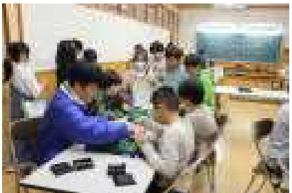
リーグ戦でのオセロ対戦は真剣勝負

クラブ活動が始まると、いよいよ上学年の仲間入り。来年度に向けた準備が少しずつ進んでいます。