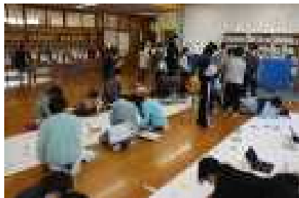
長〜い模造紙に大好きなイラスト描き