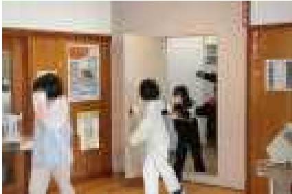
次の人に受け渡して扉をくぐります

13日（水）に冬場に火災が発生したことを想定した避難訓練を実施しました。同時に、煙の中を歩く煙道体験も行いました。訓練では実際に校内の防火シャッターを降ろして防火扉をくぐることも体験しましたが、今後もより実際に即した体験や訓練を行うことで、「自分の命を自分で守る方法」を身に付けさせていきたいと思ひます。