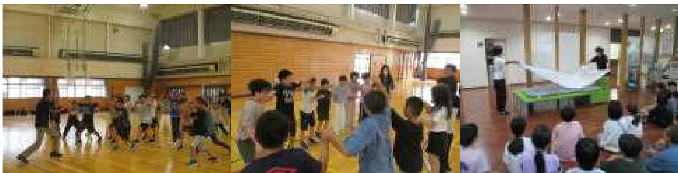
大盛り上がり、大興奮のグループワーク

4年生の子どもたちのほとんどが、一人で宿泊するのは初めてということで、心細い場面もたくさんあったと思います。しかし、友達と一緒にワクワク感から、まるで冒険を楽しむように、様々な体験に果敢に挑戦することができました。今回の体験が自信になり、精神的にも大きく成長することができました。たのもしくなったひまわり学年の今後の活躍に期待しています。