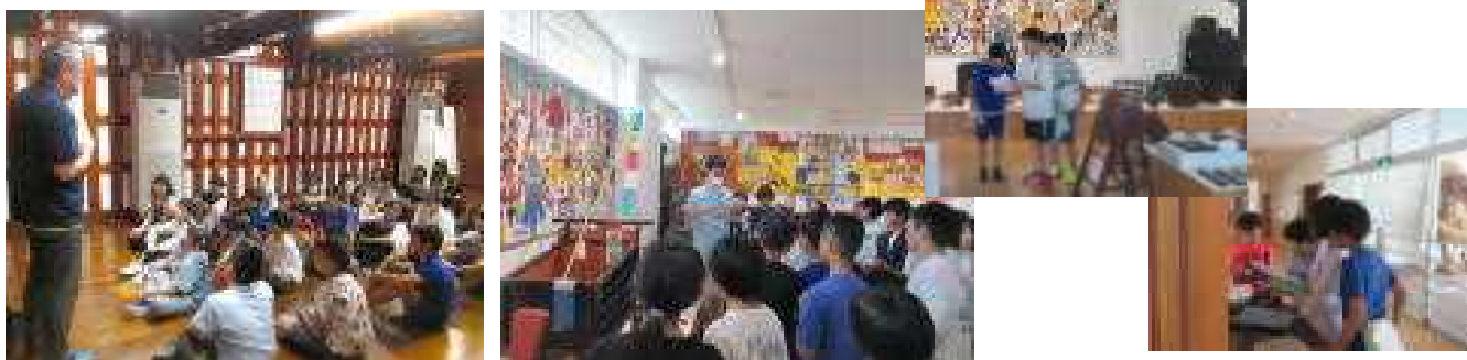
飛翔館で地域の偉人についてのお話を聞きました