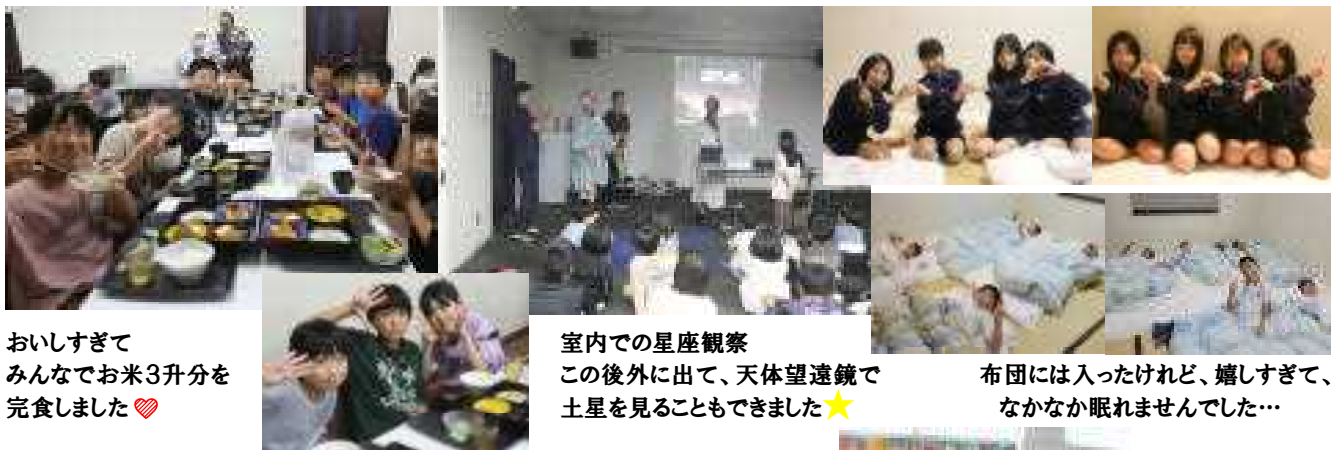
おいすぎて みんなでお米3升分を 完食しました♡