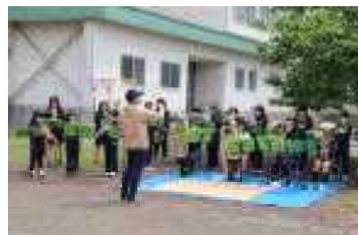
スクールバンド部の演奏で堂々の入場行進 ※今年から2年生も各色に入っています