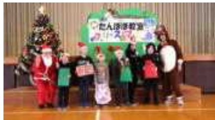
みんなで記念写真

お知らせ 本日、学校評価アンケートの集計結果をお渡ししました。保護者の皆さまからいただいた貴重なご意見を今後の学校運営に生かしていきたいと思っております。ご協力ありがとうございました。