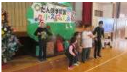
指揮に合わせたノリノリのダンス