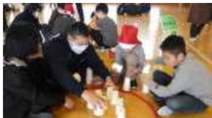
中学生も一緒に楽しいゲーム