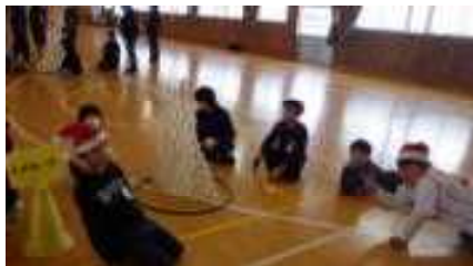
見事な紙コップタワー