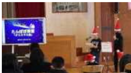
スムーズな司会・進行

このようにして迎えた本番では、全てのプログラムで学校や学年を超えて楽しい交流をすることができました。多くの友達とこれまで以上に仲よくなることができた思い出深いたんぽぽ教室となりました。