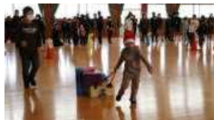
プレゼント運びリレー