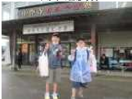
昼食後の楽しいお買い物