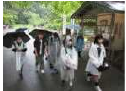
新緑が美しい中尊寺