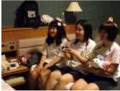
ホテルでくつろぎタイム