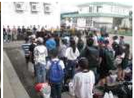
無事帰りました(解団式)

これまでの学校報は、 仙南小学校ホームページ に掲載しています。また、 Web日記 も随時更新中です。ぜひ、ご覧ください。 仙南小学校 ホームページ http://www.sennanjs.sakura.ne.jp/ または、「 仙南小学校ホームページ 」で検索してください。