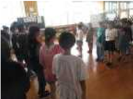
5年生と一緒に結団式