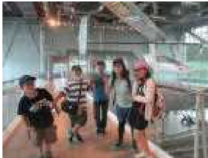
人力飛行機の前で(仙台市科学館)