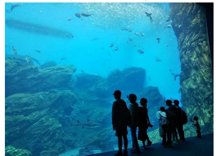
まるでスイミーの世界(うみの杜水族館)