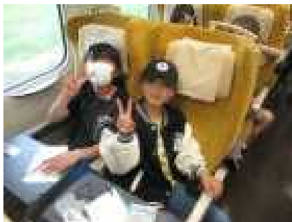
帰りの新幹線こまちの車内