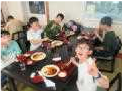
おいしい昼食(平泉レストハウス)