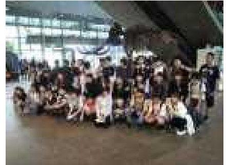
ナウマンゾウの前で(仙台市科学館)