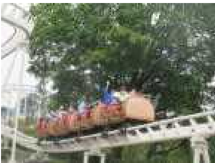
ジェットコースター(ベニーランド)