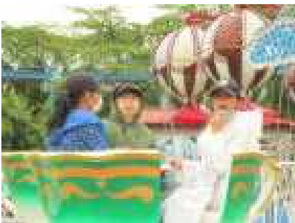
楽しいコーヒーカップ(ベニーランド)