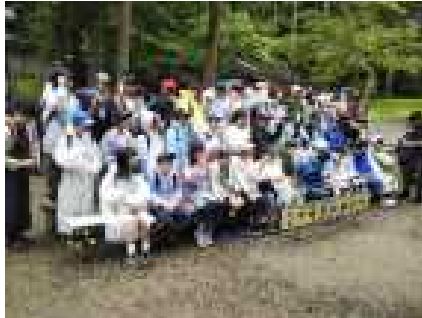
中尊寺で記念写真