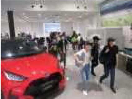
トヨタ自動車岩手工場見学