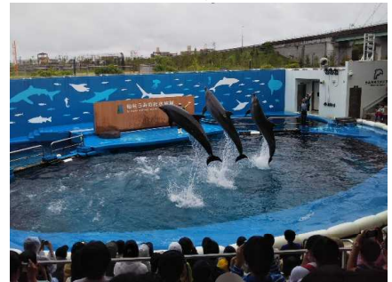
イルカの見事なジャンプ(うみの杜水族館)