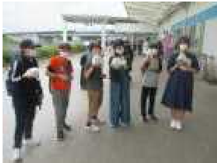
かわいいぬいぐるみを手に(うみの杜水族館)