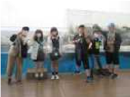
ペンギンの前で(うみの杜水族館)