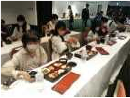
豪華でおいしい夕食