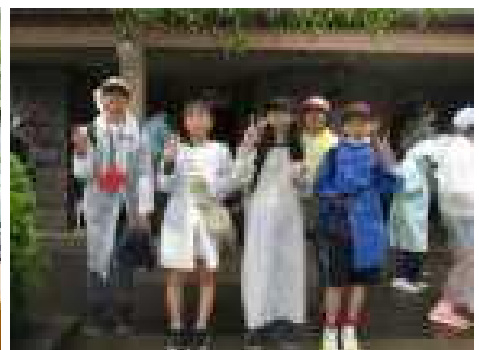
お化け屋敷を体験(ベニーランド)