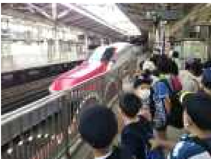
こまちがホームに(仙台駅)