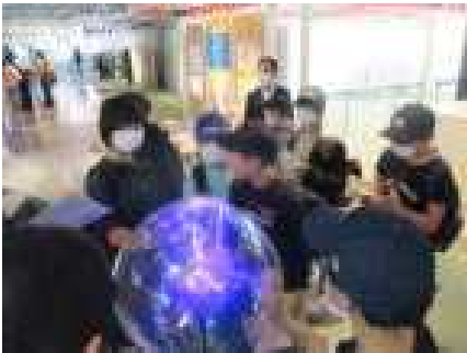
不思議な光(仙台市科学館)