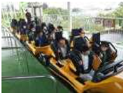
コークスクリュウに挑戦(ベニーランド)